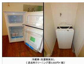
冷蔵庫・洗濯機貸出し （過去時クリーニング費5,000円×枚）