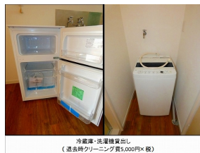
冷蔵庫・洗濯機貸出し （退去時クリーニング費5,000円×数）